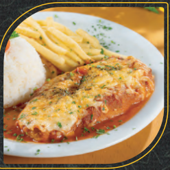
PARMEGIANA DE FRANGO Acompanha arroz e fritas.