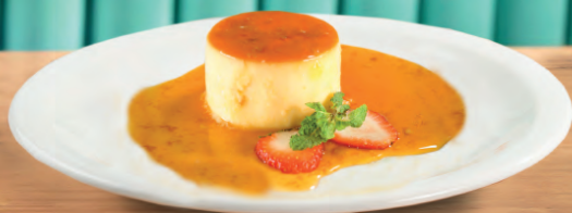
Pudim da Vovó (leite condensado)