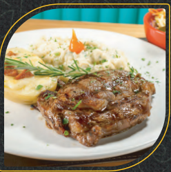
ANCHO Acompanha arroz à piemontese, batata recheada e salada.