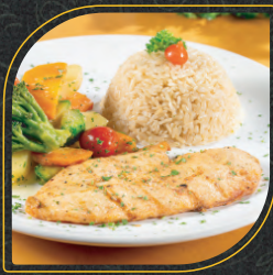
FRANGO FIT Acompanha arroz integral e salada de legumes.